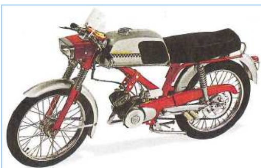
Le BB3 SP de 1963 perd ses antiques caches latéraux !