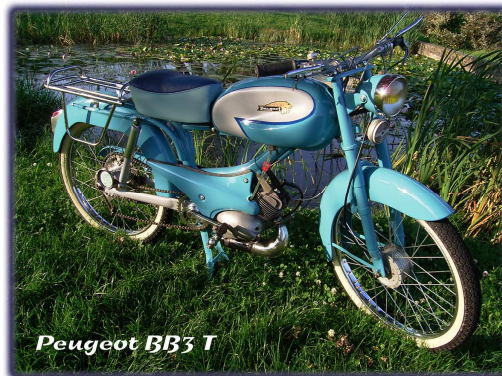
Peugeot BB3 T