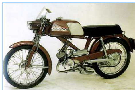
Le BB3 K avec son kick et sa plaque d'immatriculation.

La gamme des cyclosports Peugeot n'évoluera pas jusqu'en 1969 avec l'apparition du TS3.