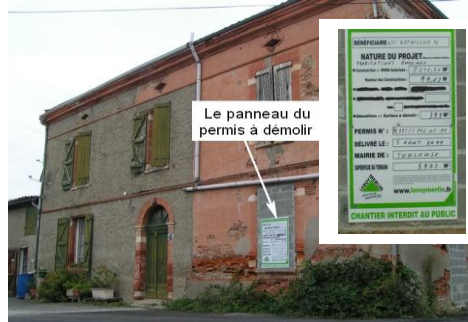
Le panneau du permis à démolir

Au vu d'un permis à démolir apposé sur les murs de la borde-rouge qui donne son nom à notre quartier et déjà inscrite dans le 1 er cadastre de la ville en 1690, notre réaction a été immédiate par recours à l'urbanisme, suivi en cela par Agir pour Croix-Daurade.