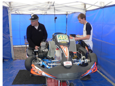
On se prépare pour la finale.