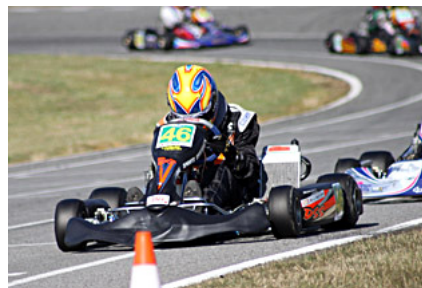
Pendant les chronos