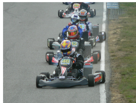
Je mène la meute...