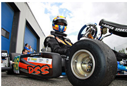
Pré grille sous l'objectif de Josiane