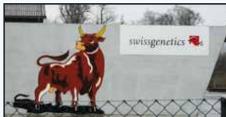
Centre d'insémination de SwissGenetics.

Ce voyage a également été l'occasion de réaliser plusieurs visites de ferme, du centre d'insémination de Swissgenetics.