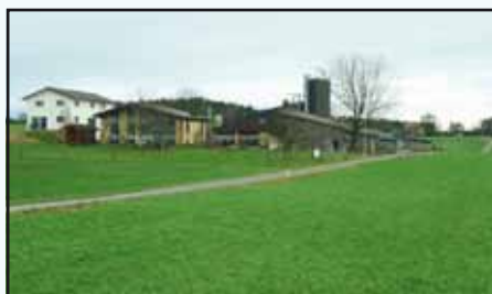
Ferme de la famille Flury