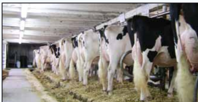
Etable des Lehoux