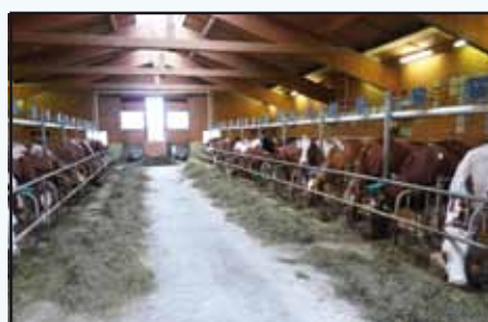
Ferme de la famille Läderach