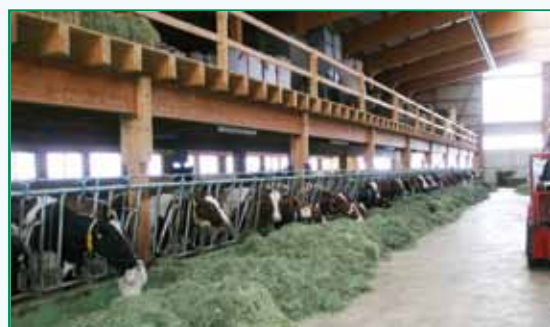
Visite de l'élevage de Christian Menoud

Alimentation à base de foin séché en grange ( complétée avec endives, maïs grain, correcteur azoté et aliment de production )