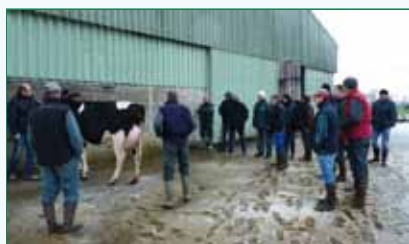
Dressage de l'animal