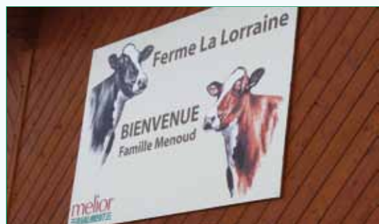
Visite de l'élevage de Lorraine Holstein

A l'initiative du syndicat, un groupe de 15 personnes a été à Swiss Expo (Lausanne) en janvier dernier. Après un voyage en minibus, bon enfant mais fatigant, la délégation a découvert un magnifique site avec plus de 1000 animaux, un concours Red et Prim'Holstein exceptionnel ( vendredi et samedi ). Le vendredi et le dimanche ont permis de découvrir 3 exploitations :