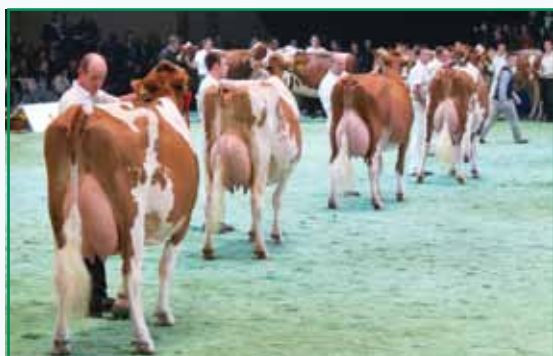
Concours de Red