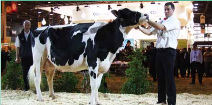
AGATHE (GAEC de la Ville Oreux), 1 er prix de section et Championnat jeune - CGA Paris 2010

Concours général Agricole Paris : 8 animaux et 8 élevages étaient représentés