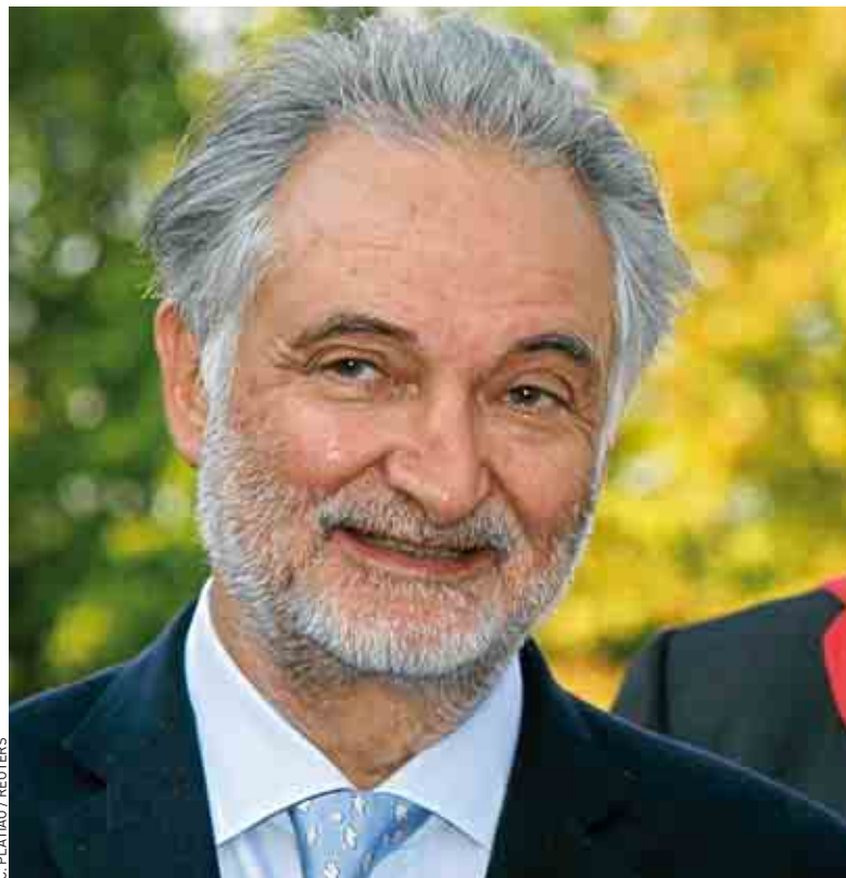
Pour Jacques Attali, la question est : « Est-ce que l'euro existera à Noël ? »

S'il le dit... Mais je pense que malheu-