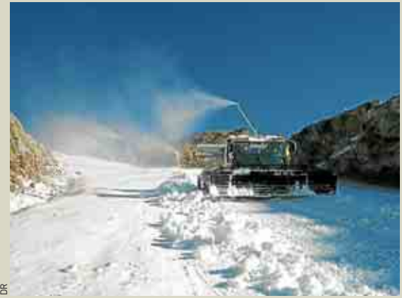
Il faudrait -4 °C pour produire de la neige de culture.