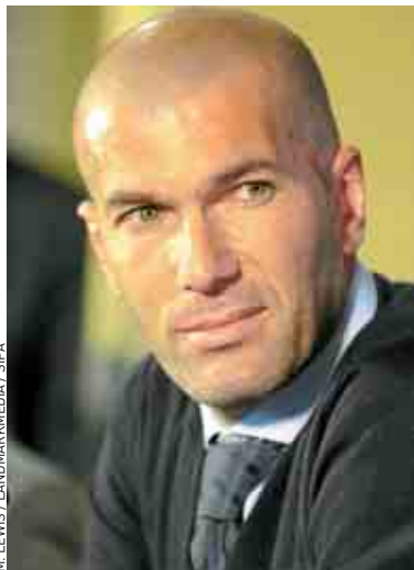
Zidane apprend des outils de gestion.