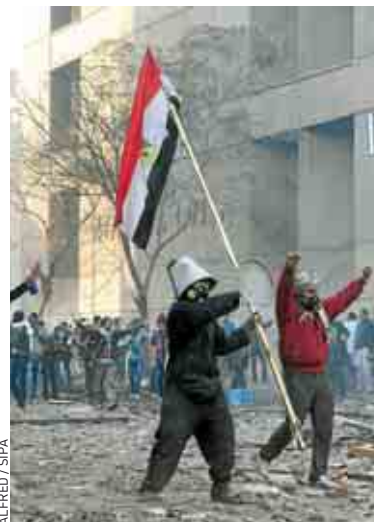
La place Tahrir, hier au Caire.

Aidée par des journalistes égyptiens, l'équipe de France 3 s'est ensuite réfugiée dans un hôtel de la place Tahrir. La journaliste a alors contacté sa rédaction à Paris qui a déclenché une assistance. Ils ont alors été examinés par un médecin de l'ambassade. « Je l'ai eu au téléphone, elle était logiquement choquée, mais tenait à monter son sujet qui est passé au journal du