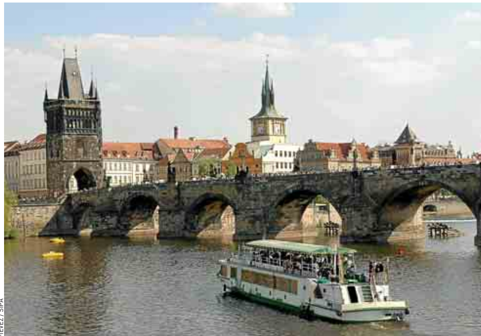
Le pont Charles sur la rivière Vltava offre une vue imprenable sur la vieille ville.

Repérable à son enseigne – un tigre doré – et à ses vitraux opaques, cette taverne mythique a traversé les vicissitudes de l'histoire et la réputation de sa bière n'est plus à