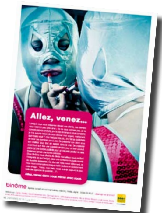
Pub "Agence Binôme" - page 16 - juin 2011

Cible élargie : 25-35 ans, étudiants, publics aimant sortir, boire et manger et consommer des services et produits culturels, publics nostalgique et attaché à l'identité de la ville. Nîmois d'origine exilés dans d'autres villes et/ou pays ayant gardé des attaches familiales ou amicales. Nouveaux arrivants à Nîmes.