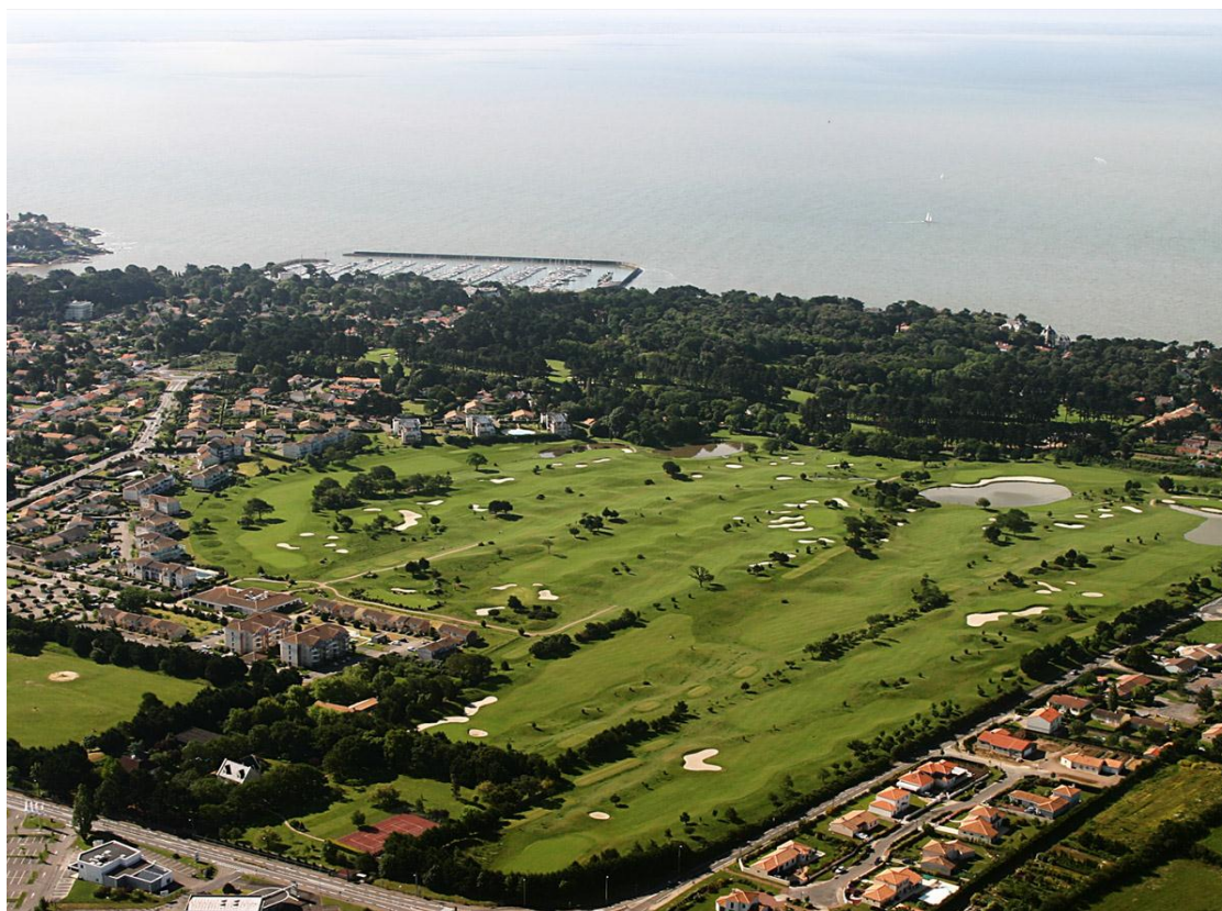
Le Golf de Pornic créé en 1912