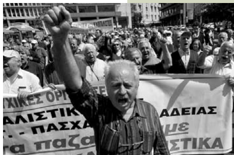
Manifestation des retraités contre la baisse des pensions, 2009.

Ce qui plus est en 2012, selon le mémorandum II, le salaire mensuel de base (salaire brut) a diminué d'un autre 22%, de 751€ à 586€, pour les employés de plus de 25 ans, alors que pour ceux de moins de 25 ans il a chuté de 32%, à savoir de 751€ à 511€, soit 427€ 10 salaire net, la réduction réelle des salaires en 2012 atteignant 30%. Ainsi, le salaire horaire s'élevant à 2,7€, typiquement les salaires se retrouvent aux niveaux de 2005, tandis que le pouvoir d'achat réel du salaire moyen a reculé aux niveaux de 2003, et du salaire de base aux niveaux de la fin des années 1970.