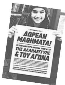
Ecole sociale à Naupacte.

couvrir le coût élevé des cours privés. Les classes sociales sont organisées par l'assemblée des enseignants, des parents et des élèves qui soulignent que leur but n'est pas remplacer l'enseignement public qui est en danger, mais faire face aux inégalités du système éducatif qui se rétrécit et se dégrade par les politiques des mémorandums, en aggravant les discriminations de classe et en réduisant les chances des enfants qui appartiennent aux classes inférieures. L'Ecole de Solidarité de Nikaia, un quartier ouvrier très pauvre, a été créé en Mars 2012, suite à l'initiative d'un groupe de professeurs qui se sont adressés à l'Union des Associations des Parents de Nikaia, qui a embrassé le projet. L'an dernier l'Ecole a eu