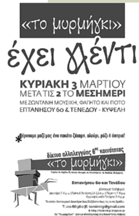
Affiche d'une manifestation du groupe «Fourmi» à Athènes.