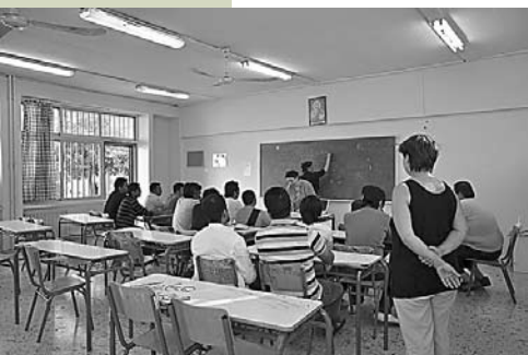
L'École Ouverte des Immigrés au Pirée

Nous avons formé cet ample et varié mouvement de solidarité pas seulement pour reconforter les gens, mais aussi dans la perspective de construire un autre monde, au delà des normes existantes du profit et du marché. Contre la destruction (des restes) de l'état social et de la cohésion sociale, nous répondons avec la création de nouvelles structures de solidarité, nous construisons de nouveaux types de relations sociales, de nouveaux quartiers, de nouveaux espaces publics, qui seront le prélude d'un changement social général.