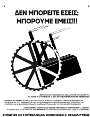
Affiche de l'usine reprise et autogérée par les employés de «Viomichaniki Metaleftiki» (Vio. Me.) (2012).

dans les quartiers, d'initiatives de défense des espaces publics etc. A côté de ces structures, on a une multitude de coopératives : des cafés, des sociétés de courrier, de réparations d'ordinateurs, des librairies, des coopératives agricoles créées par des femmes au chômage; Il s'agit d'une propagation de diverses formes socialisées et autogérées de travail, de différents types d'une économie solidaire. En novembre 2012, 93 sociétés sociales dans tout le pays étaient candidates pour le Registre des sociétés sociales du Ministère de Travail; la moitié d'entre elles se trouvent à Athènes. En plus, ces deux dernières années, on constate la création de diverses sociétés sociales qui ne suivent pas