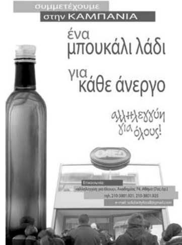
Affiche de la «solidarité pour tous» pour la campagne «une bouteille d'huile pour chaque chômeur».

La «Solidarité pour Tous» se veut une petite pierre de plus dans l'édifice de la lutte pour une vie sans mémorandums, sans pauvreté, exploitation de l'homme, fascisme et racisme; dans la perspective de créer les conditions nécessaires à un renversement radical politique, à une transformation sociale.