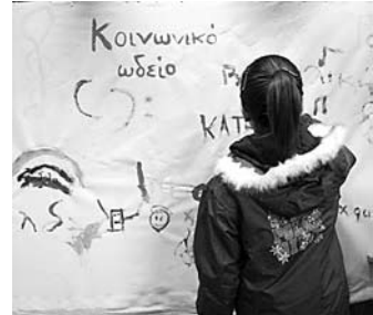
Conservatoire social à Athènes

La création, il y a plus de dix ans, de dizaines d'espaces alternatifs sociaux par des initiatives autonomes de citoyens, des mouvements sociaux et des groupes radicaux de la gauche a formé un réseau informel qui est devenu lieu de développement de nouvelles idées et pratiques concernant les activités qui sont citées ci-dessus. Ces espaces alternatifs s'inscrivent dans le cadre d'une nouvelle culture politique d'autogestion, embrassant un grand spectre d'activités –politiques, culturelles ou autres-, réalisées par des initiatives et des groupes divers, des comités de résidents etc. ; leur but est créer des lieux de rencontre et d'organisation collective dans chaque quartier. Un projet très original est celui de l'Ecole de Musique, créée par des professeurs de musique qui ont lancé un appel dans le twitter, en février 2012, à ceux qui s'intéressaient à des cours de musique gratuits. L'an dernier l'Ecole a fonctionné avec 80 élèves qui suivaient les cours à trois endroits et régions différents, alors que cette année elle a ouvert deux espaces supplémentaires. Ses 120 élèves ont été sélectionnés auprès de 1000 candidats ; la raison de la sélection a été le manque de professeurs et d'espace. Il y a plus de 50 professeurs de musique qui travaillent à l'Ecole et une trentaine de volontaires qui s'occupent du secrétariat ; l'assemblée est constituée des professeurs, des élèves et de leurs parents.