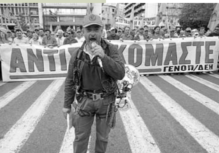
Le syndicat de la Power Public Corporation (PPC) en grève, 2011.

ment (à l'Etat et les banques) afin de se débrouiller, alors que 50% ne dispose pas de revenus suffisants pour couvrir ses engagements (lumière, eau, énergie, prêts) 24 . Selon, Art. Zervos, président et chef de la direction du PPC, en 2011 PPC a fait plus de 400.000 arrangements, alors qu'en 2012 le nombre des arrangements est estimé à plus de 700.000 25 . Dans le même temps, PPC interrompt l'alimentation électrique de 30.000 foyers par mois en moyenne.