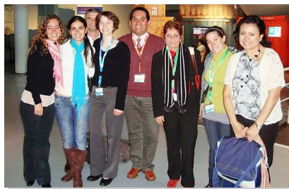
Délégation d'Amérique Latine du Réseau Océan Mondial—Nausicaá, 2010

réflexion élaborées seront transmises au Conseil d'Administration, qui formulera des propositions.