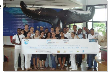
1er Parlement des Jeunes de l'Outre Mer Français — La Réunion, 2009, Kelonia

Si l'organisation d'un Parlement des Jeunes qui se déroule sur plusieurs jours s'avère difficile, on peut envisager la possibilité d'organiser un Forum des jeunes sur un temps réduit (une journée par exemple).