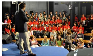
Nausicaa, 2009 (5)