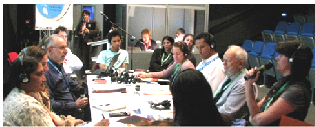
4ème Rencontre Internationale WON—Nausicaá, 2010

Des membres du Réseau ont réfléchi au sein d'un atelier sur le fonctionnement du Réseau et les conditions d'adhésion des membres. Les pistes de