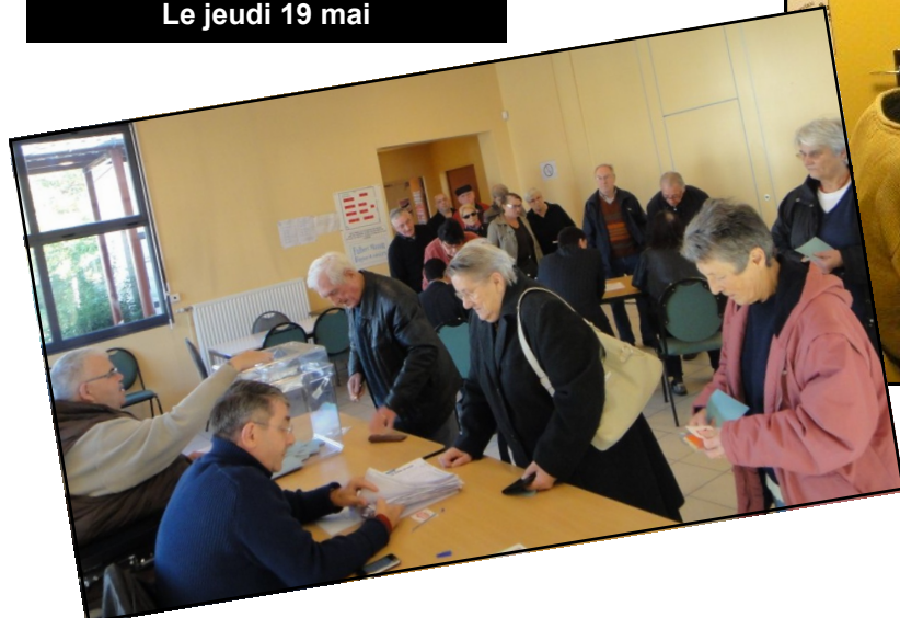
Le succès des Primaires Citoyennes des 9 et 16 octobre