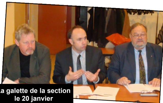
La galette de la section le 20 janvier