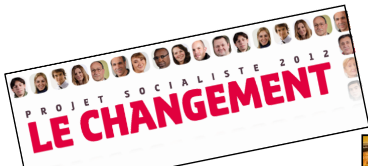
L'adoption du projet du Parti Le jeudi 19 mai