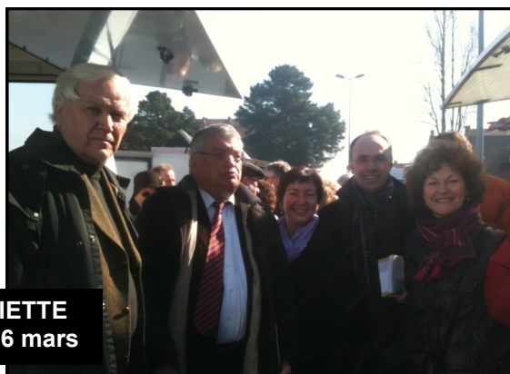
Avec Jacques AUXIETTE à la Cité des Pins le 6 mars

Je pense également que nous n'avons pas à rougir de la campagne que nous avons menée localement avec une présence très assidue des militants de notre section sur les marchés de la Cité des Pins et de Pontlieue comme a pu le constater Jacques Auxiette lors de sa venue à la Cité des Pins le 6 mars.