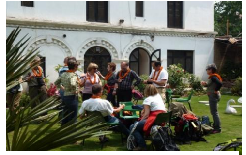
Des colliers de fleurs pour fêter la bienvenue à Katmandu

Au départ de Genève et de Paris, la rencontre se fait à Doha et nous arrivons en pleine forme à Kathmandu.