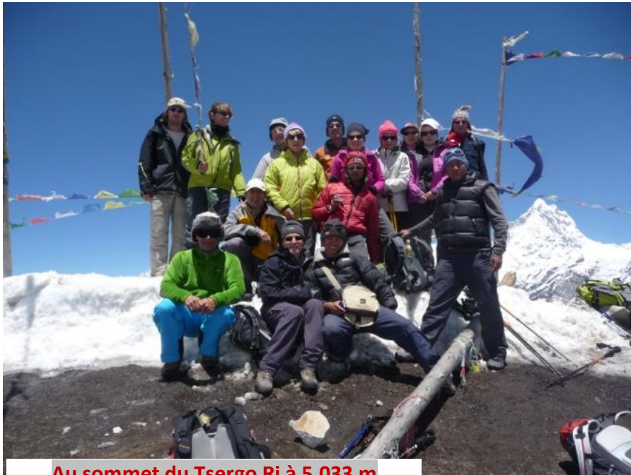
Au sommet du Tsergo Ri à 5.033 m

Départ le lundi 14 mai à 4 h pour le Tsergo Ri à 5.033m. Un sommet facile mais un peu