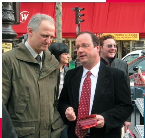
Christophe Caresche avec François Hollande, place de Clichy dans le 18 e