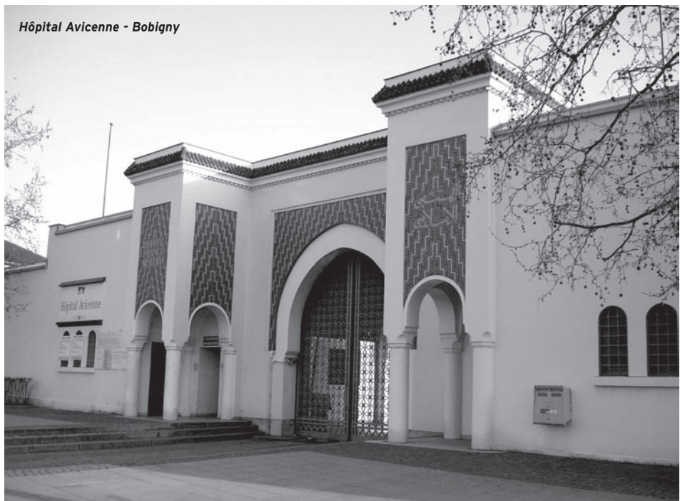
Hôpital Avicenne - Bobigny

La double singularité - biologique et culturelle - dans laquelle se trouvaient enfermés les migrants dès qu'on évoquait la question de leur santé occultait une réalité pourtant bien plus préoccupante : les inégalités sociales devant la maladie et les soins dont ils étaient les victimes. Cette occultation était d'autant plus facile qu'on ne disposait quasiment d'aucune donnée d'ensemble sur le sujet, puisque le système d'information sanitaire français, comme du reste l'ensemble de l'appareil statistique national, ne permettait pas de mesurer des disparités en fonction du lieu de naissance et ne donnait lieu que rarement à des calculs des différences en fonction de la nationalité. Dans ces conditions, on ne savait presque rien des inégalités de santé qui affectent les immigrés (nés hors de France) ou les étrangers (non Français). Lorsque le sujet était abordé, on se contentait de l'idée rassurante selon laquelle ces inégalités ne faisaient que traduire les disparités socioéconomiques de la population en général, éventuellement compliquées des différences biologiques et culturelles liées à leur origine géographique. Ainsi, disait-on, toute chose égale par ailleurs,