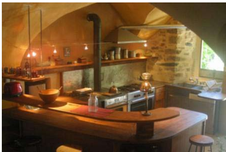
Cuisine de Soubroche