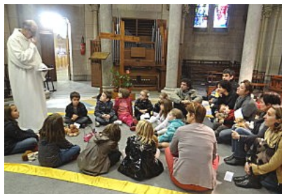
La petite enfance fait Alliance avec Dieu