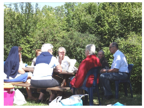
Chapelle de Rousse