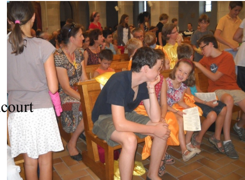
La paroisse accueille le M.E.J.