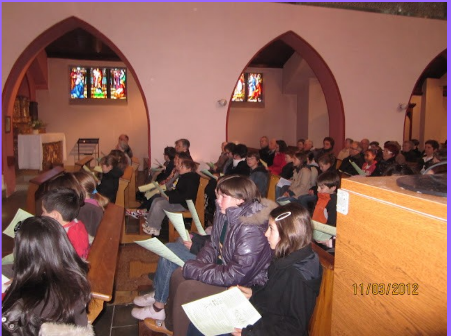
Remise du livre de la Parole de Dieu