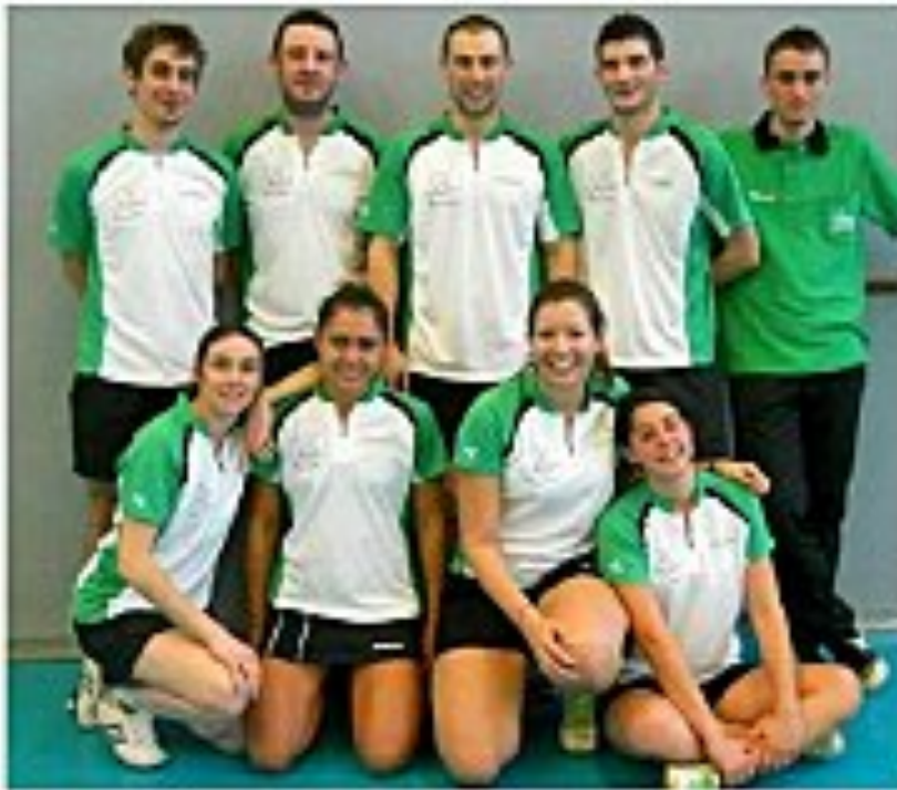
Les équipes premières du SAS badminton.

La section badminton de Saint-Averin-Sports a bien démarré la saison en championnat de Nationale 3. Actuellement en tête de sa poule après trois journées de compétition, l'équipe 1 du SAS badminton reçoit l'équipe réserve de Saibris dans le cadre de la quatrième journée. Cette rencontre entre les deux premiers de la poule pourrait permettre à Saint-Averin de prendre ses distances avec les autres équipes. Le SAS est actuellement 1 er avec 9 points (3 victoires), devant Saibris, 0 points (2 victoires, 1 nul). Les dirigeants de la section espèrent que les saint-averinois vont saisir cette occasion d'assister à du haut niveau avec la présence de plusieurs joueurs du top 200 français, sans oublier l'attaquante Hlaredonska, joueuse internationale polonaise dans les rangs de Saibris. L'équipe de Saint-Averin compte sur la présence de nombreux supporters pour l'aider à relever cet énorme défi.