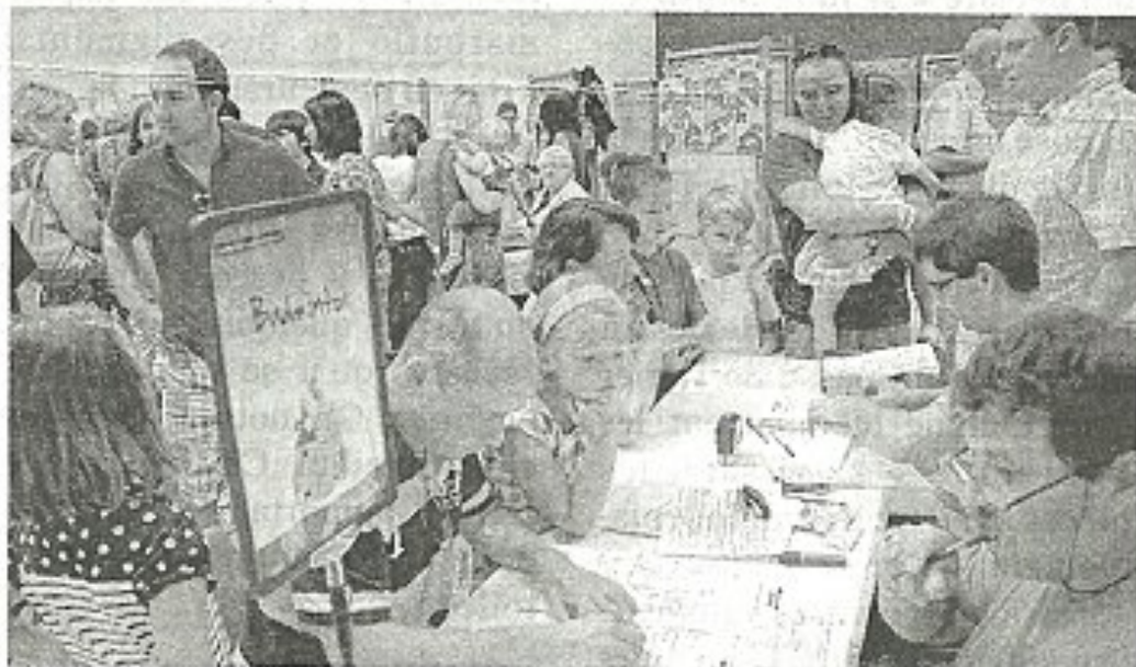
La section a enregistré de nombreuses adhésions lors de la Journée des associations.

Site Internet du club : http://www.sasbadminton.fr/