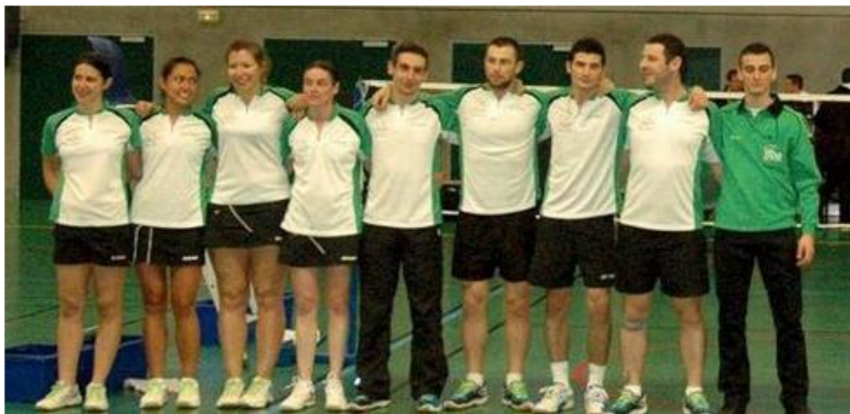
L'équipe 1 re du SAS badminton est toujours en course pour la montée.

Dimanche 29 janvier, l'équipe 1 de badminton de Saint-Avertin renouait avec le championnat par équipe de national 3 après plus d'un mois de coupure. Pour cette première rencontre de l'année qui lançait les matchs retours, les Saint-Avertinois se sont imposé 7 à 1, soit le même score qu'à l'aller, ce qui leur permet de garder le contact avec le leader de la poule et d'asseoir un peu plus leur deuxième place. Seul un point les sépare de la première après six journées de championnat; il leur en reste encore quatre pour refaire leur retard. L'équipe 1 reste plus que jamais en course dans la qualification aux barrages pour la montée en national 2, même si, pour cela, elle se doit de faire un parcours sans faute lors des quatre journées restantes.