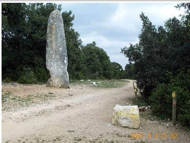
Azimut de la prise de vue : 100 gr