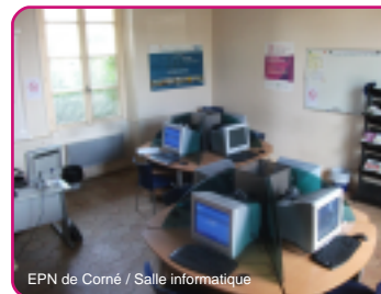
EPN de Corné / Salle informatique

Les permanences, des créneaux accessibles en libre service !