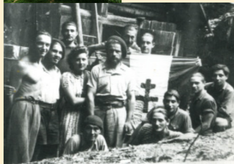
Les maquisards du camp des Clents de Lanton.