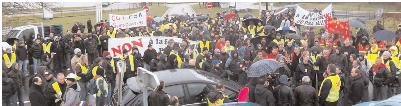
Travailleurs de PSA en grève aux côtés de ceux de Renault, devant l'usine de Cléon le 30 janvier 2013

La grève se poursuit toujours à l'usine PSA d'Aulnay-sous-Bois. Mercredi 13 mars, elle est entrée entrée dans sa neuvième semaine.