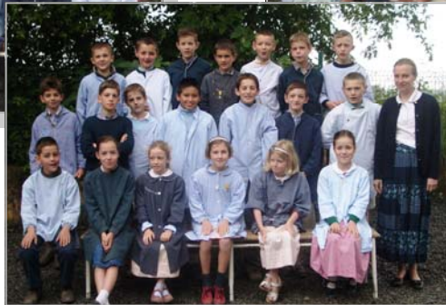
Les CM1 et CM2