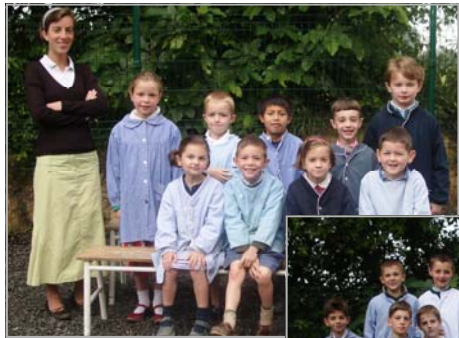
Les CP et GS

6. Nous voulons pour finir tous vous remercier Directrice et maîtresses, bricolage et ménage Et Sainte Philomène qui sur nous tous veille Sur notre école joyeuse, petite et animée.