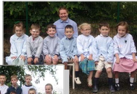
Les PS et MS