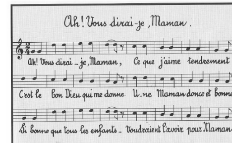
GS et CP à l'occasion de la fête des Mères