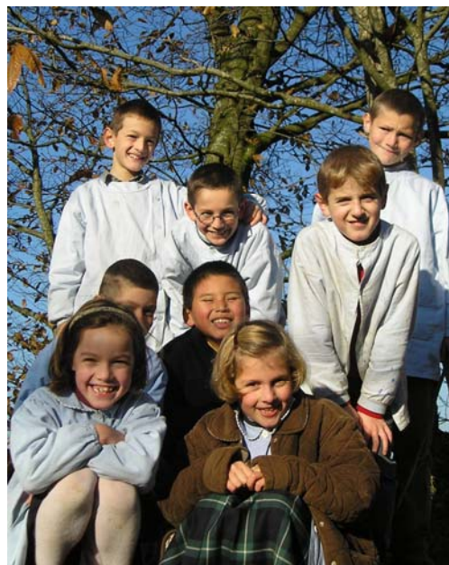
Les CE2 sous le soleil !