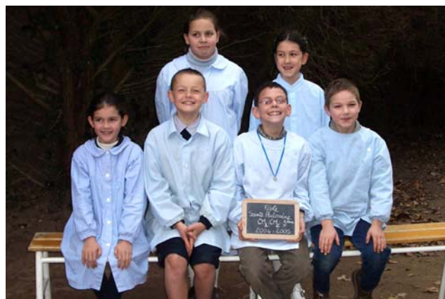
Classe de CM1, CM2 et 5ème

Les entreprises assujetties à l'impôt sur le revenu ou sur les sociétés sont autorisées à déduire du montant de leur résultat, dans la limite de 3,25% de leur chiffre d'affaires, les versements qu'elles ont effectué au profit de l'Ecole Sainte Philomène