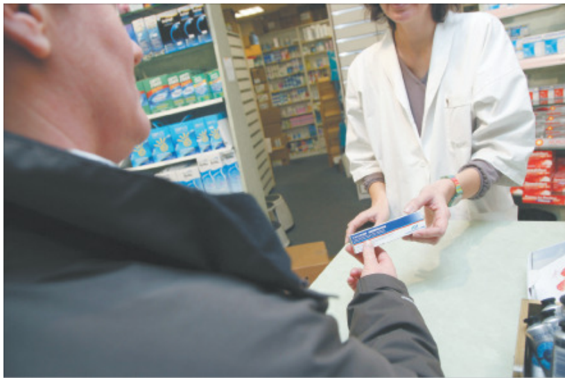
Le vaccin peut être délivré à partir d'aujourd'hui en pharmacie

À PARTIR d'aujourd'hui, jeudi 29 septembre, près de 21 millions d'assurés sont invités à retirer gratuitement leur vaccin contre la grippe dans les pharmacies de l'Hexagone. La Caisse nationale d'assurance-maladie (CNAM) vient en effet de donner le coup d'envoi de la campagne 2011-2012, avec l'objectif de renforcer la couverture vaccinale des populations à risque. « Cette mobilisation est d'autant plus importante que la dernière campagne nationale a été marquée par une baisse de la vaccination des populations à risque, rappelle la CNAM. Le taux de couverture vaccinale était de 51,8 % en 2010 contre 60,2 % en 2009. Ce recul est un risque réel pour les sujets vulnérables qui doivent être protégés des complications sévères que le virus grippal peut engendrer. » L'objectif : atteindre un taux de couverture vaccinale des sujets