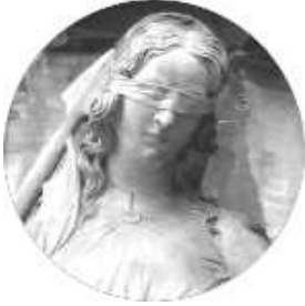
Statue représentant la synagogue aveuglée

Judaïsme / Catholicisme L'Ancienne Alliance avec le peuple juif était une alliance temporaire ayant pour but l'avènement du Messie ; une fois le Messie venu, l'Ancienne Alliance disparaît, remplacée par la Nouvelle. N'existant plus, elle ne peut avoir de rôle pour le salut. « C'est lui, (Jésus), la pierre rejetée par vous (les juifs) [...] le salut n'est en aucun autre, car il n'est sous le ciel aucun autre nom donné parmi les hommes, par lequel nous devons être sauvés. » (Actes 4,11-12)