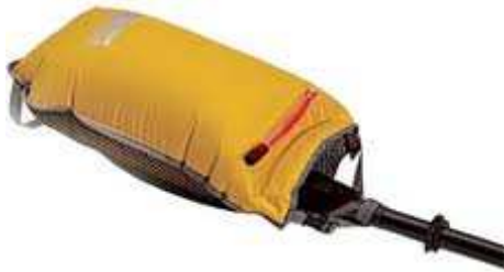
paddle-float - gonflable