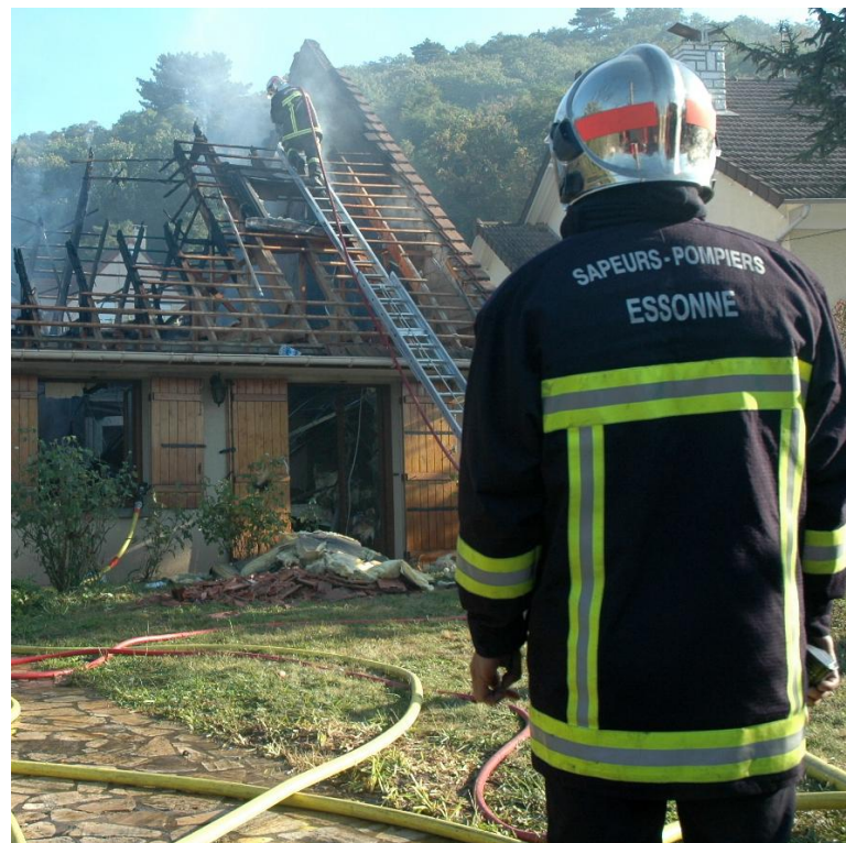
Les sapeurs-pompiers de l'Essonne vont manifester aujourd'hui pour dénoncer une proposition de loi qui veut réformer et « optimiser » leur temps de travail. (L.P./S.B.)

« A Evry, par exemple, 16 pompiers effectuent 9 000 interventions dans l'année, les sapeurs ne dorment pas de la nuit », assure Jérôme Cailleau. De plus, les professionnels du feu