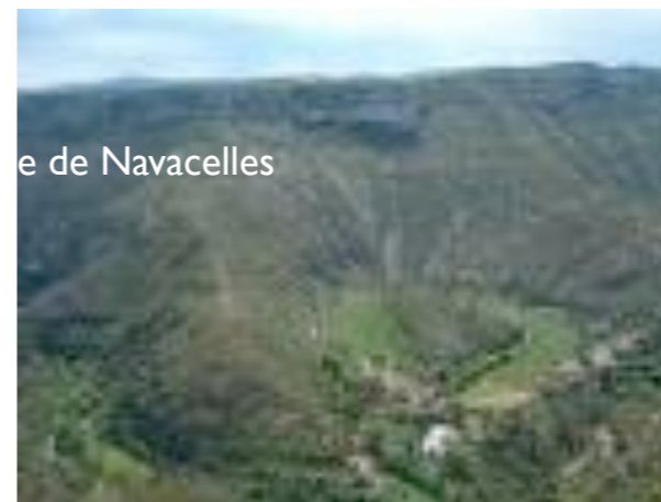
e de Navacelles