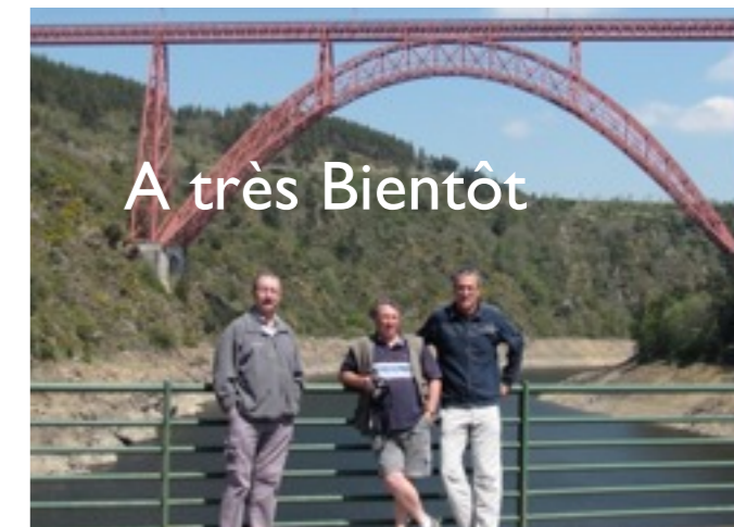
A très Bientôt