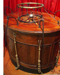
et son Baquet