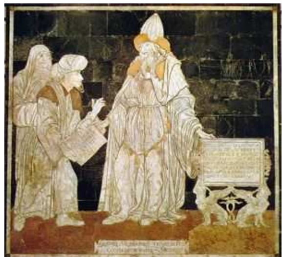
Le chapeau des voyageurs