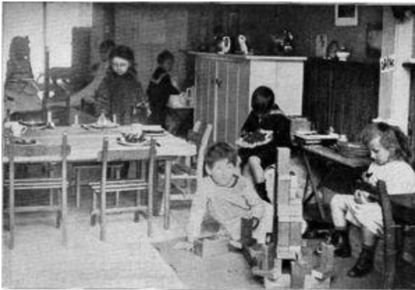
École Montessori à la Haye en 1915

« Il avait semblé alors que pour assurer au monde un avenir de paix, rien ne pouvait être plus efficace que de développer dans les jeunes générations le respect de la personne humaine par une éducation appropriée. Ainsi pourraient s'épanouir les sentiments de solidarité et de fraternités humaines qui sont aux antipodes de la guerre et de la violence. »