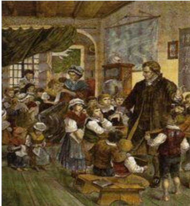
L'école de Johann et Anna Pestalozzi