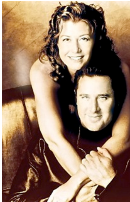
Vince Gill & Amy Grant