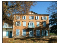
Centre Social Le Tournesol 178 Chemin d'Arras 01600 Trévoux 04 74 00 56 20