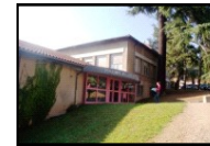
Maison de la Petite Enfance Chemin du Clos 01600 Trévoux 04 74 00 57 15