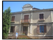
Epicerie solidaire 82 grande rue 01600 Trévoux 09 63 66 82 13

L'Épicerie Solidaire est un établissement de l'association Val Horizon.