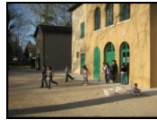
Mini Crèche Le Tournesol 54 Allée de Fétan 01600 Trévoux 04 74 08 58 23