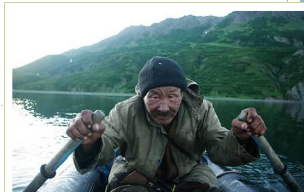
Rameur Tchouktches Nord Kamtchaka - été 2011