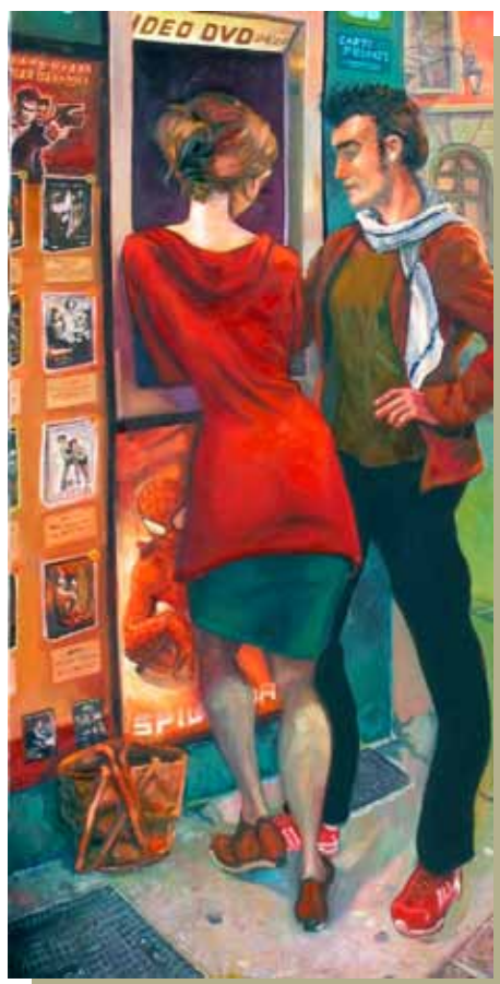
Jeune couple LCR au vidéomatique, huile sur toile, 97 x 195 cm