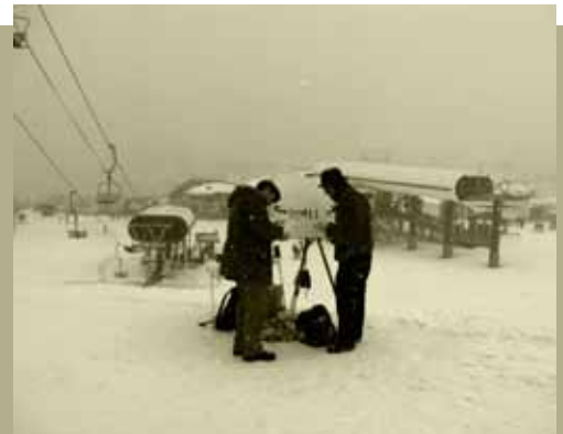
Gigot flageolets stoppant le bus miss-France, peinture au pied des pistes de ski