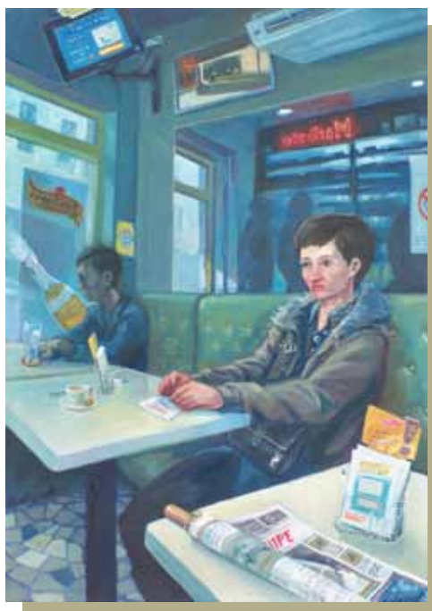
La joueuse de rapido, huile sur toile, 50 x 65 cm