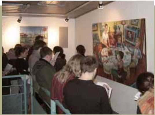
Découverte du Conisme à travers les différents documents...