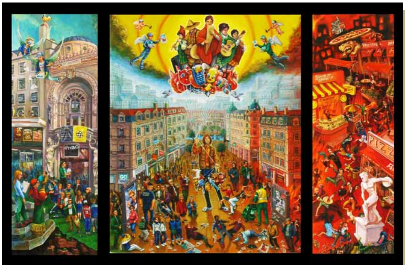
El condor pasa, triptyque sur bois, 180 x 160 cm