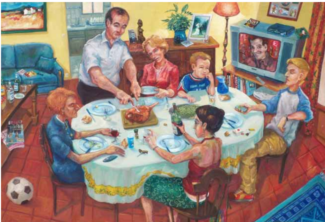
Gigot Flageolets, huile sur toile, 195 x 130 cm