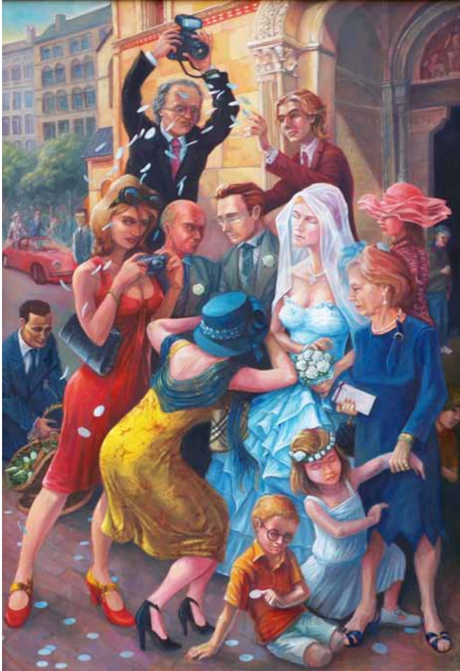
Les noces du Figaro, huile sur bois, 168 x 245 cm