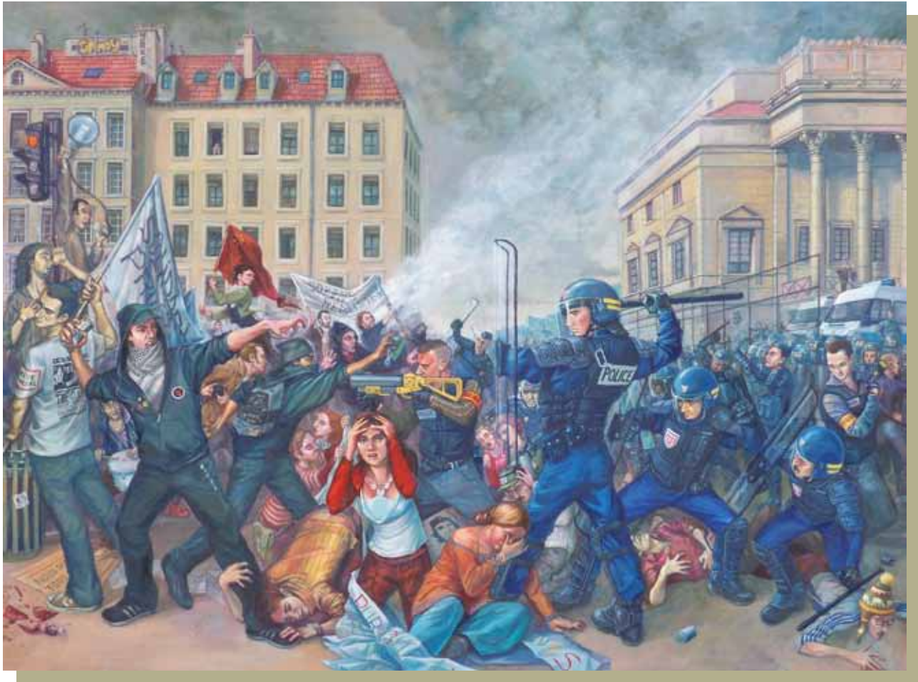
La bataille de l'esplanade du palais de justice, huile sur bois, 240 x 180 cm