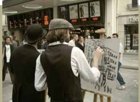
Rue de la république à Lyon: esquisses sur le motif pour le retable «El Condor Pasa»