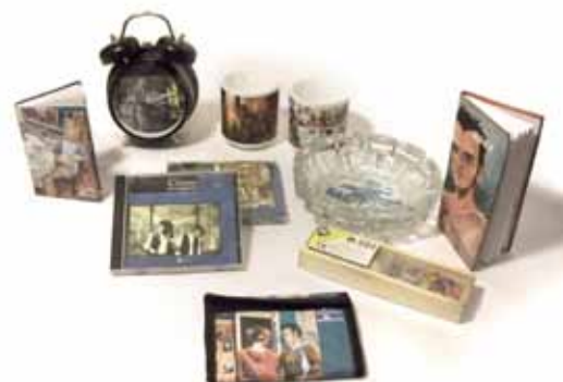
.Les ouvrages consultables pendant les expositions et le merchandising