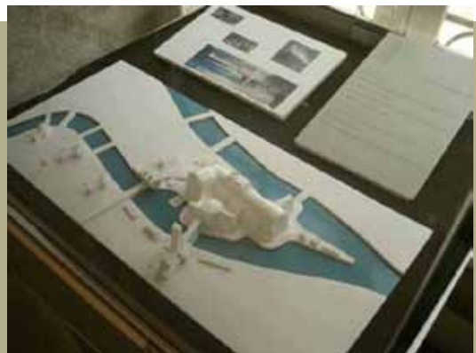
L'espace boutique et la maquette du futur musée «Convergence-Conisme»