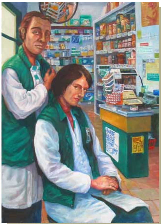
Mon épicier est un type formidable, huile sur toile, 97 x 130 cm