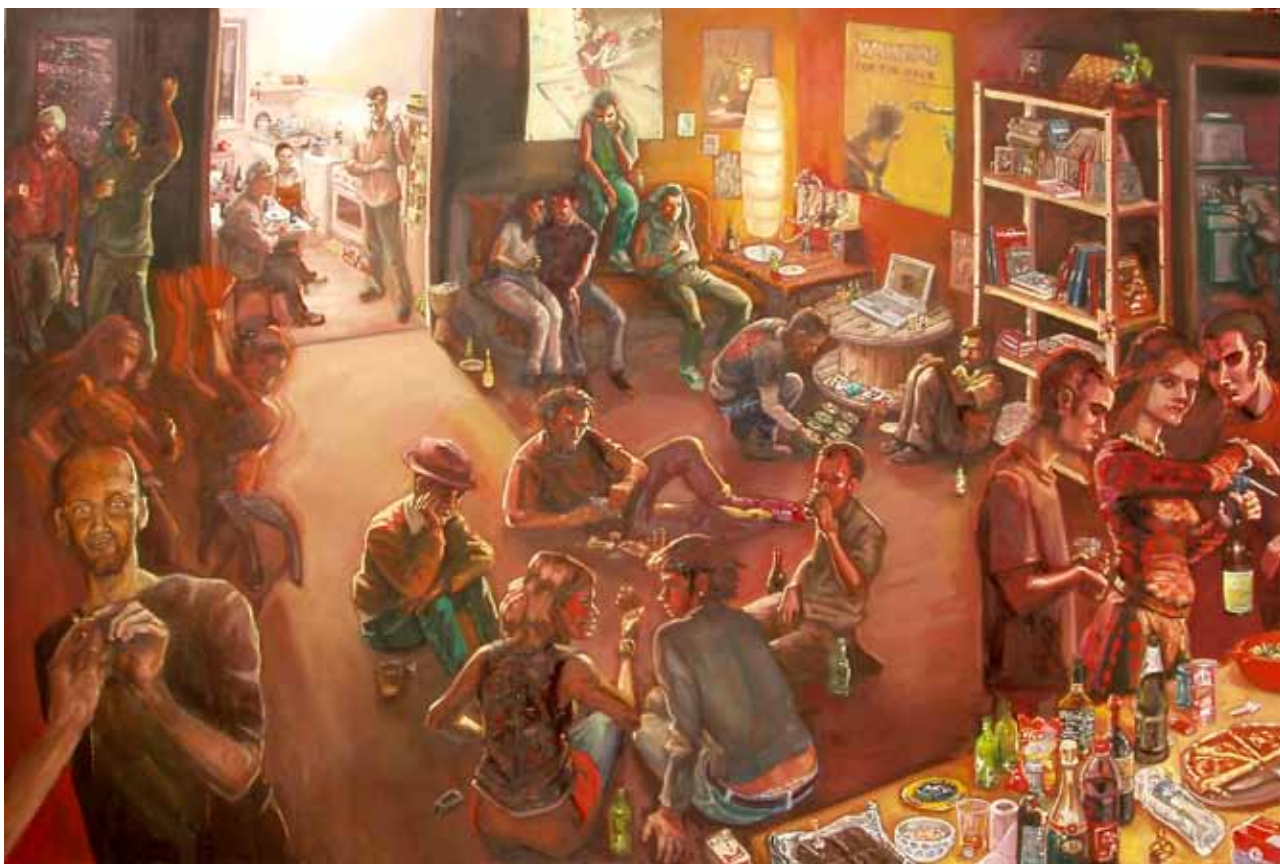
Le grand soir, huile sur toile, 195 x 130 cm