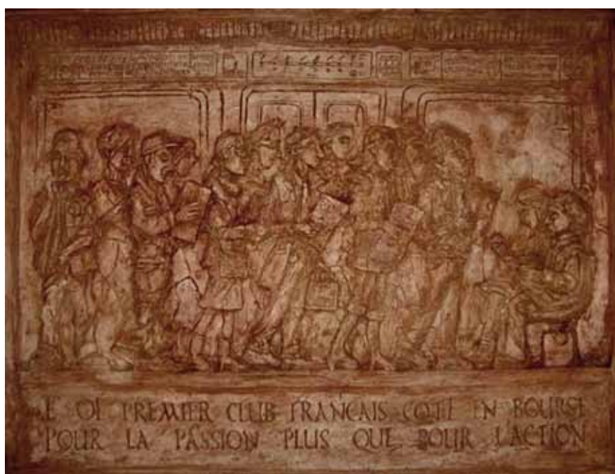
Comme un lundi, haut relief de la cathédrale Saint-Ringo, 80 x 60 cm