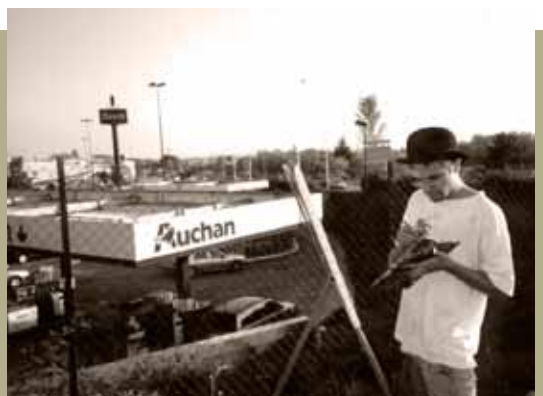
Les berges du Rhône et les ronds-points offrent d'excellents points de vue pour le paysage champêtre.