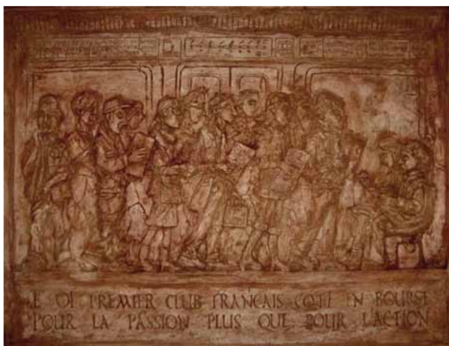
Comme un lundi, haut relief de la cathédrale Saint-Ringo, 80 x 60 cm