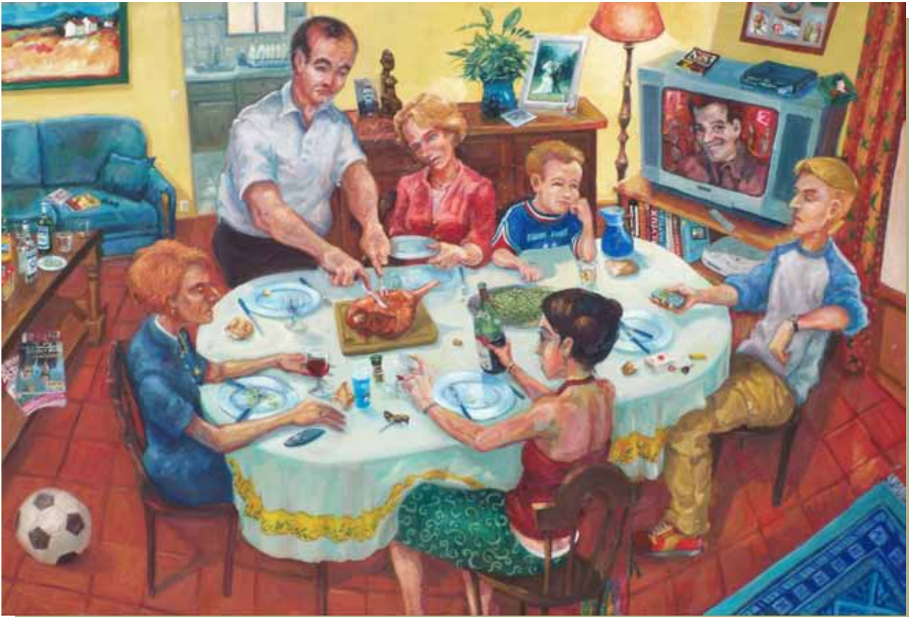
Gigot Flageolets, huile sur toile, 195 x 130 cm