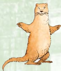
A - loutre