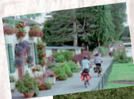
Les usagers des canaux (cyclo, marcheurs)