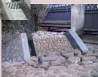
Passes à anguilles à l'écluse n°48 du Châtelier

Les pêcheurs profitent eux aussi des rives. La pêche, autorisée toute l'année mais avec quelques restrictions durant la période de frai, bénéficie de nombreux aménagements : passes à anguilles, à poissons, parkings, postes de pêche adaptés pour les personnes à mobilité réduite.