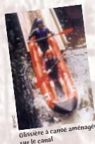
Glissière à canoë aménagée sur le canal