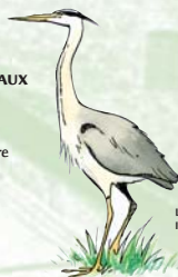
Le héron cendré Il peut vivre jusqu'à 25 ans.

Les berges des canaux accueillent de nombreuses espèces d' OISEAUX comme la poule d'eau, le canard colvert, la bergeronnette des ruisseaux, le busard des roseaux, la marouette, le cormoran, la foulque ou encore le héron cendré et le martin-pêcheur . L'interdiction de chasser aux abords des canaux permet de manière indirecte la protection de ces espèces.