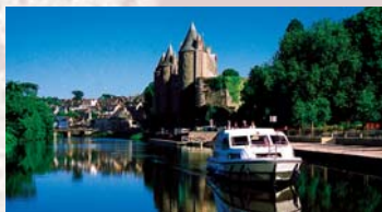
Escapade en bateau...

Aujourd'hui, la navigation de plaisance prend le relais de la navigation commerciale. Dans les ports de Dinan (22), Nantes, Sucé-sur-Erdre, Nort-sur-Erdre (44), Messac, Redon (35), Glénac (56), Châteauneuf du Faou (29), des loueurs proposent des bateaux habitables et faciles à manœuvrer. Des compagnies proposent également des croisières découvertes, accompagnées de guides.