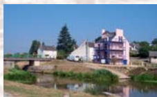
Maison du Canal de Pont-Miny et son gîte d'étape. Fégréac