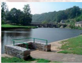
Le canal accessible à tous. Poste de pêche adapté

Les pêcheurs profitent eux aussi des rives. La pêche, autorisée toute l'année mais avec quelques restrictions durant la période de frai, bénéficie de nombreux aménagements : passes à anguilles, à poissons, parkings, postes de pêche adaptés pour les personnes à mobilité réduite.