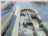
Passes à poissons à l'écluse n°26 du Grand Barrage