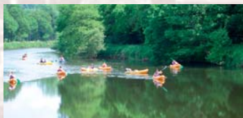
Canoës et kayaks

Afin d'accueillir au mieux les usagers des canaux, des aménagements ont été réalisés sur l'eau et au bord de l'eau. Les rivières et les plans d'eau sont équipés de bases de loisirs nautiques proposant de nombreuses activités : canoës, kayaks, aviron, pédalo... Pour la pratique du canoë et du kayak, certaines écluses sont équipées de glissières permettant le passage des embarcations. Enfin, la Bretagne intérieure dispose de zones de baignade et de plages artificielles.