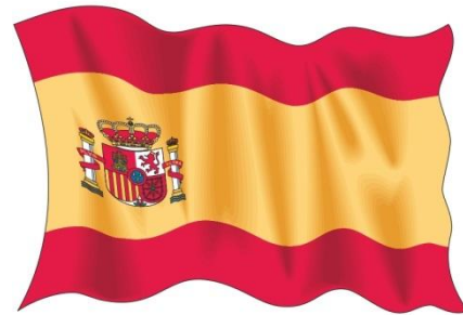
Aprender español; la bandera de España; rojo / amarillo; visitar el país; ser turista