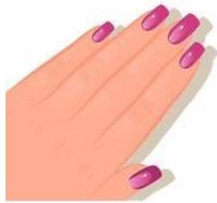
Las uñas; comerse; ser elegante; el esmalte de uñas