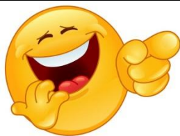
Reír a carcajadas; contar una broma; ser alegre