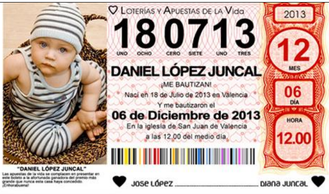
Un décimo de lotería; ganar / perder