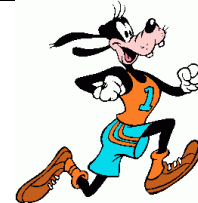
Hacer deporte; sano para la salud; practicar una actividad física