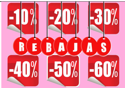
Etiquetas; porcentaje; rebajas; ahorrar dinero