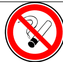
Dejar de fumar; una prohibición; sana para la salud