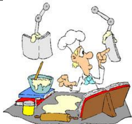
Cocinar; seguir las etapas de la receta; ser rico