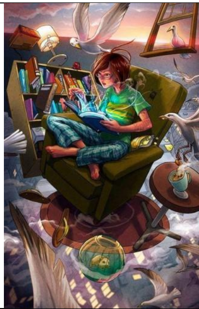
Un libro; las aventuras; leer; la imaginación