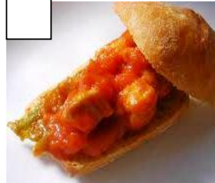
MAGRA CON TOMATE (échine de porc avec de la tomate)