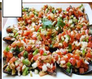
PIPIRRANA (ensalada de pepino, pimiento y tomate)