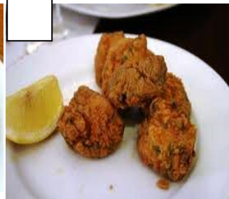
CAZÓN (es un pescado)