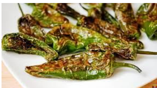
Pimientos de Padrón (fritos y picantes)