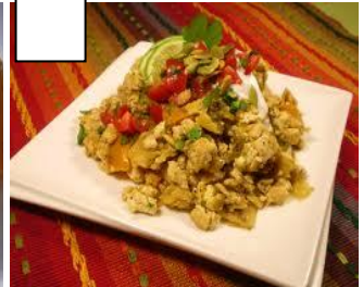
MIGAS (ragoût de pan frit avec des lardons)