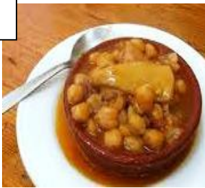
CALLOS (des tripes pimentées avec des pois chiche)