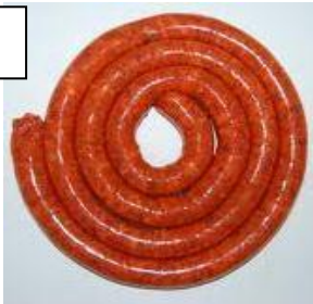
CHISTORRA (tipo de chorizo)