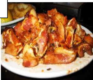
OREJAS (oreilles de porc cuites et pimentées)