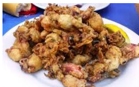
Chopitos ( des encornets )

5. ¿Cuál es el estribillo ( refrain ) de la canción? Escríbelo aquí: _____