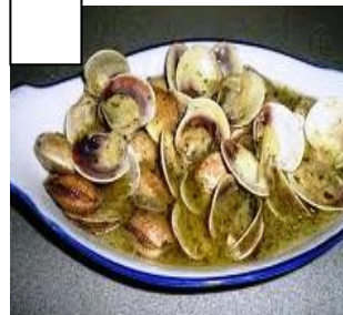
CHIRLAS (petites coques)