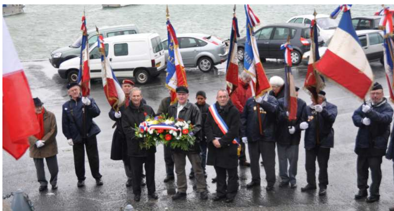
11 novembre 2010, le Porte Drapeau de Valcanville était présent, avec ses camarades des communes voisines, à la cérémonie de Barfleur