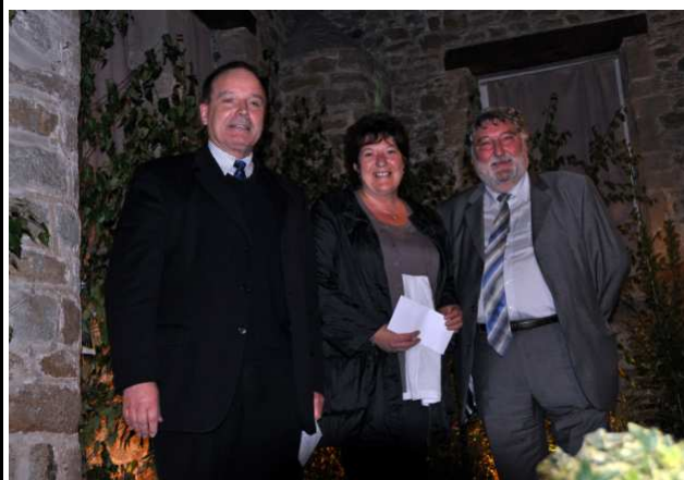
Les maires des communes de Valcanville, Le Vicel, Morsalines

Par ailleurs, comme les communes amies de MORSALINES et du VICEL, VALCANVILLE s'est vu attribuer un prix de fleurissement ; cela nous encourage à accentuer nos efforts en procédant à des plantations de végétaux dans de nouveaux espaces publics.