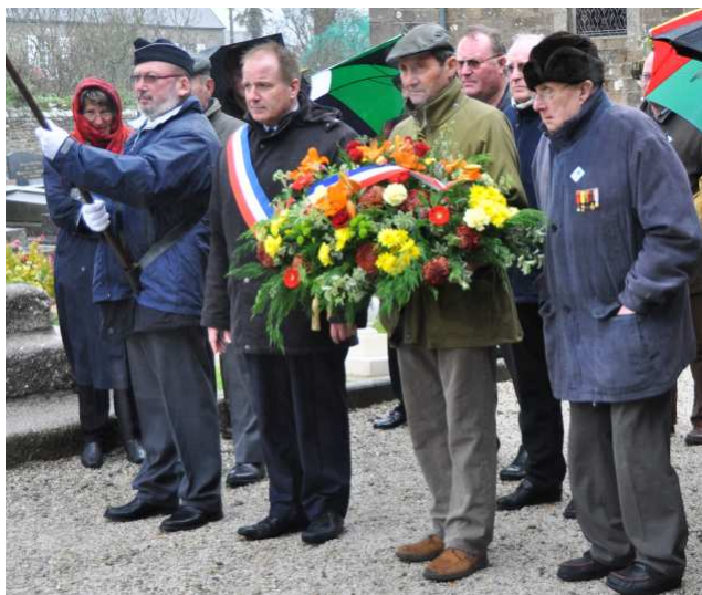
11 novembre 2010, devant le monument aux morts.