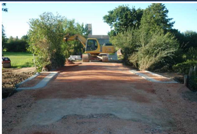
Les derniers travaux de reconstruction du pont

Les travaux ont été réalisés par l'entreprise TPB (Travaux Publics Brix). L'opération d'une valeur de 50 000 euros a été conduite pour le Conseil Général de la Manche par l'Agence Technique du Cotentin basée à Valognes.