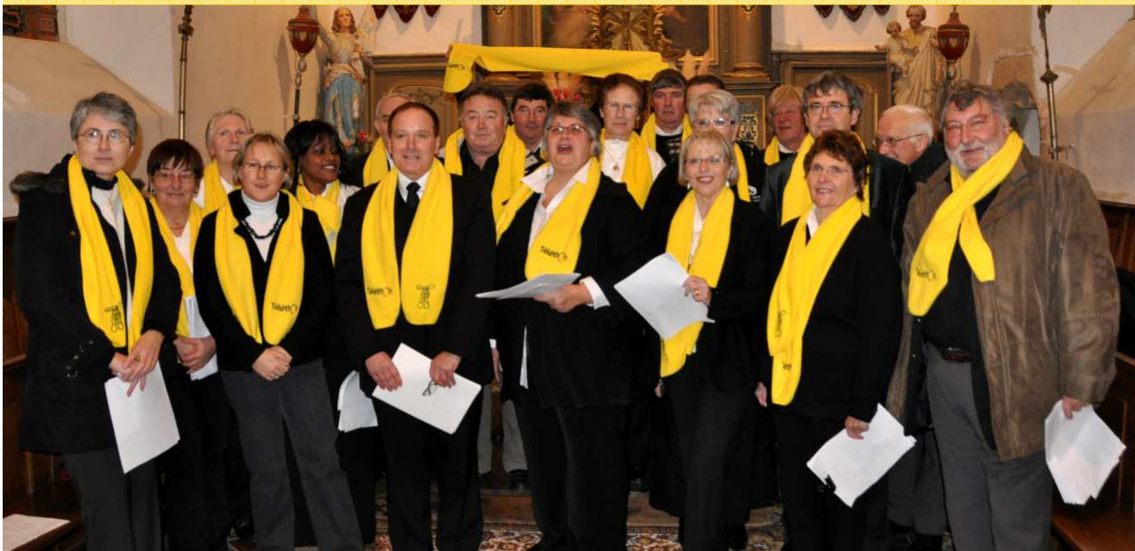
La chorale, des élus venus des deux cantons de Quettehou et Saint Pierre Eglise