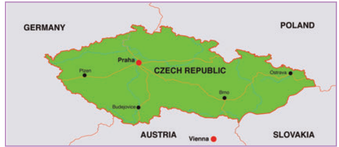
Carte de la République tchèque

Adhésion à l'Union européenne et entrée dans l'OTAN