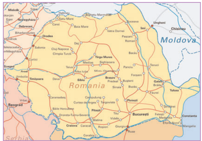
Carte de la Roumanie

Albanie exceptée, la Roumanie est le pays le moins urbanisé d'Europe centrale et orientale. Après avoir subi une nationalisation de type soviétique, le pays bénéficie d'un programme de stabilisation économique lancé par le FMI en 1997. Si la situation économique s'est améliorée (le PIB a connu une forte croissance - 8,3 % en 2004 - et l'inflation est passée de 40,7 % à 9,3 % en 4 ans), le malaise social et politique s'en est trouvé exacerbé : les réformes mettent en relief les faiblesses de l'économie roumaine, entraînant inflation et perte de pouvoir d'achat. La première loi relative aux privatisations remonte à 1991, mais une ordonnance s'est