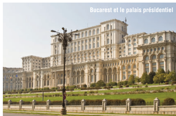
Bucarest et le palais présidentiel