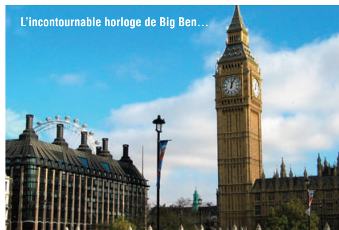
L'incontournable horloge de Big Ben...

présente les deux tiers du PIB, est devenu le moteur de la croissance britannique. L'assurance, l'électronique et les industries pharmaceutiques et énergétiques sont aujourd'hui parmi les plus compétitives d'Europe. La City de Londres demeure une place financière de première importance. Le pays enregistre depuis quelques années des évolutions positives de ses indicateurs macroéconomiques et un taux de chômage très bas, malgré une persistance d'une forte proportion de la population vivant sous le seuil de pauvreté. Le Royaume-Uni connaît aujourd'hui une hausse du déficit des finances publiques, destinée à financer la rénovation des services publics entreprise par le gouvernement à la suite de deux décennies de thatcherisme qui ont laissé les services publics de santé et d'éducation dans une situation très délicate. ●