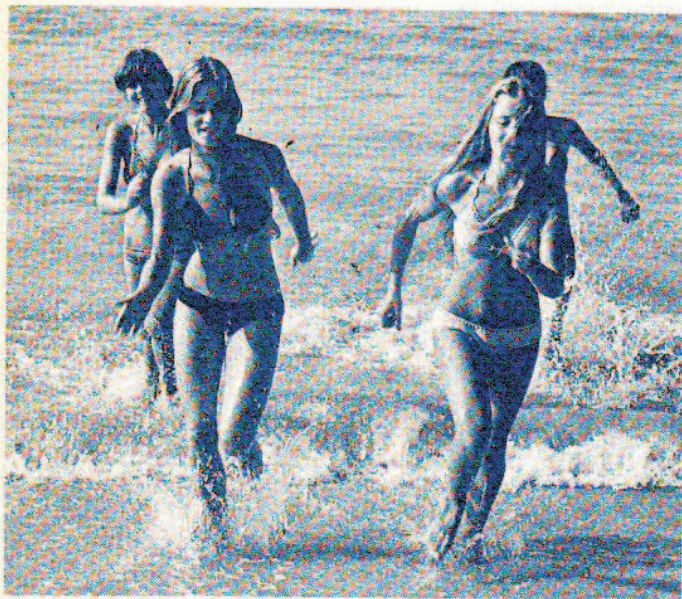
Les maillots de bain (suite de la page 96)