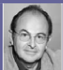
Luc Béraud Cinéaste