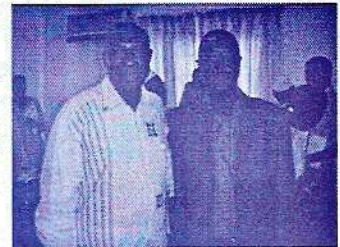
Le Président du CNC et de la CENI