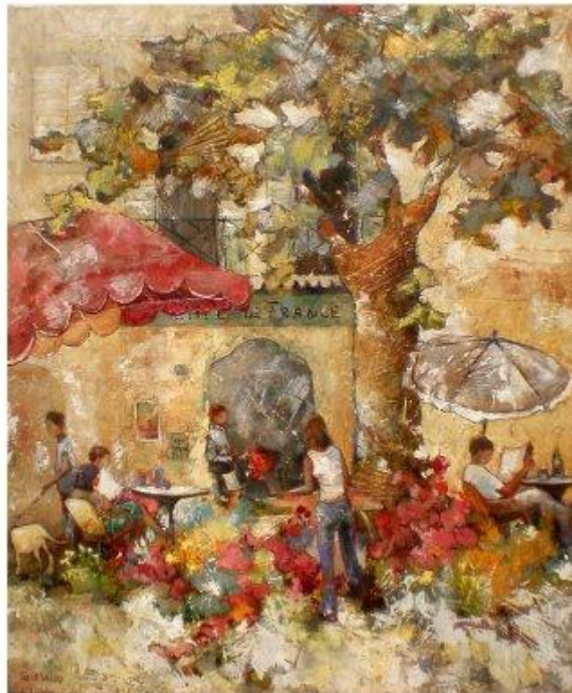
Peinture à l'huile de Mathilde Grimaud