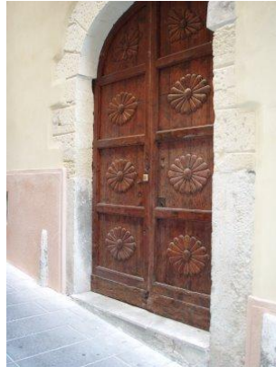
Porte cochère -- Cagliari --