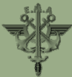
Etat-major des armées

Inflexions civils et militaires : pouvoir dire