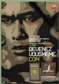
Recrutement de l'armée de Terre