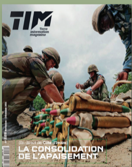
Terre Info Magazine